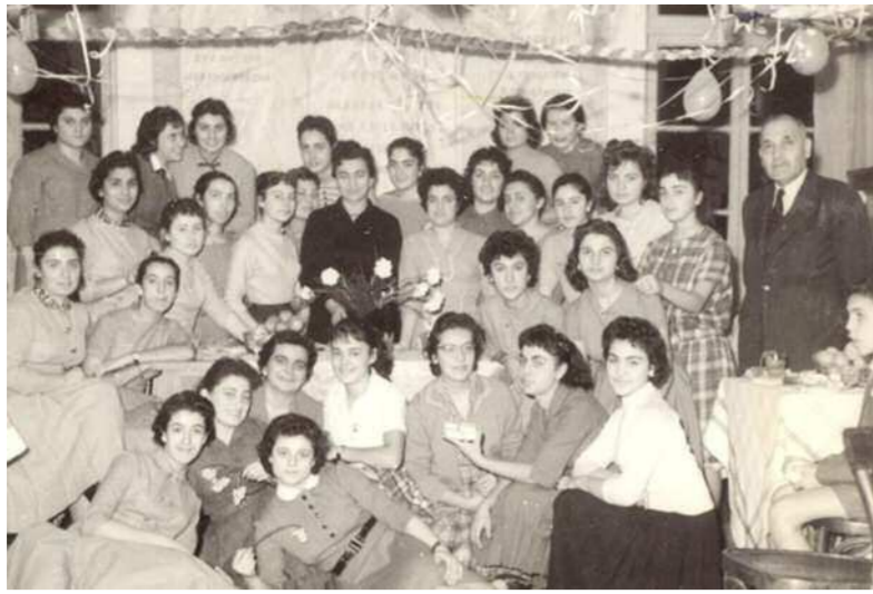
Όταν το σχολείο ήταν γεμάτο από νιάτα