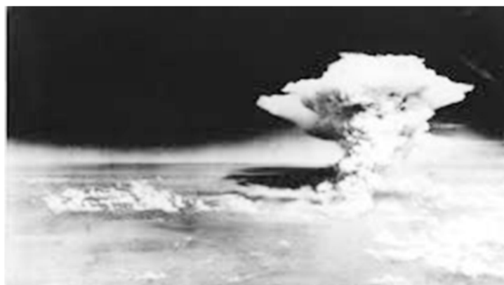
Ναγκασάκι 70 χρόνια πριν...